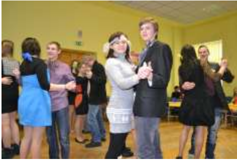
Valentīndienas pasākuma dalībnieku pirmā deja