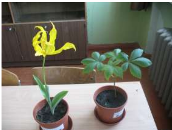
5.klases tulpe un kastaņa

6.klase – tulpe ļoti labi aug. Arī kastaņa jau diezgan paaugusies. Nevar sagaidīt, kad izdīgs Kanādas egle.