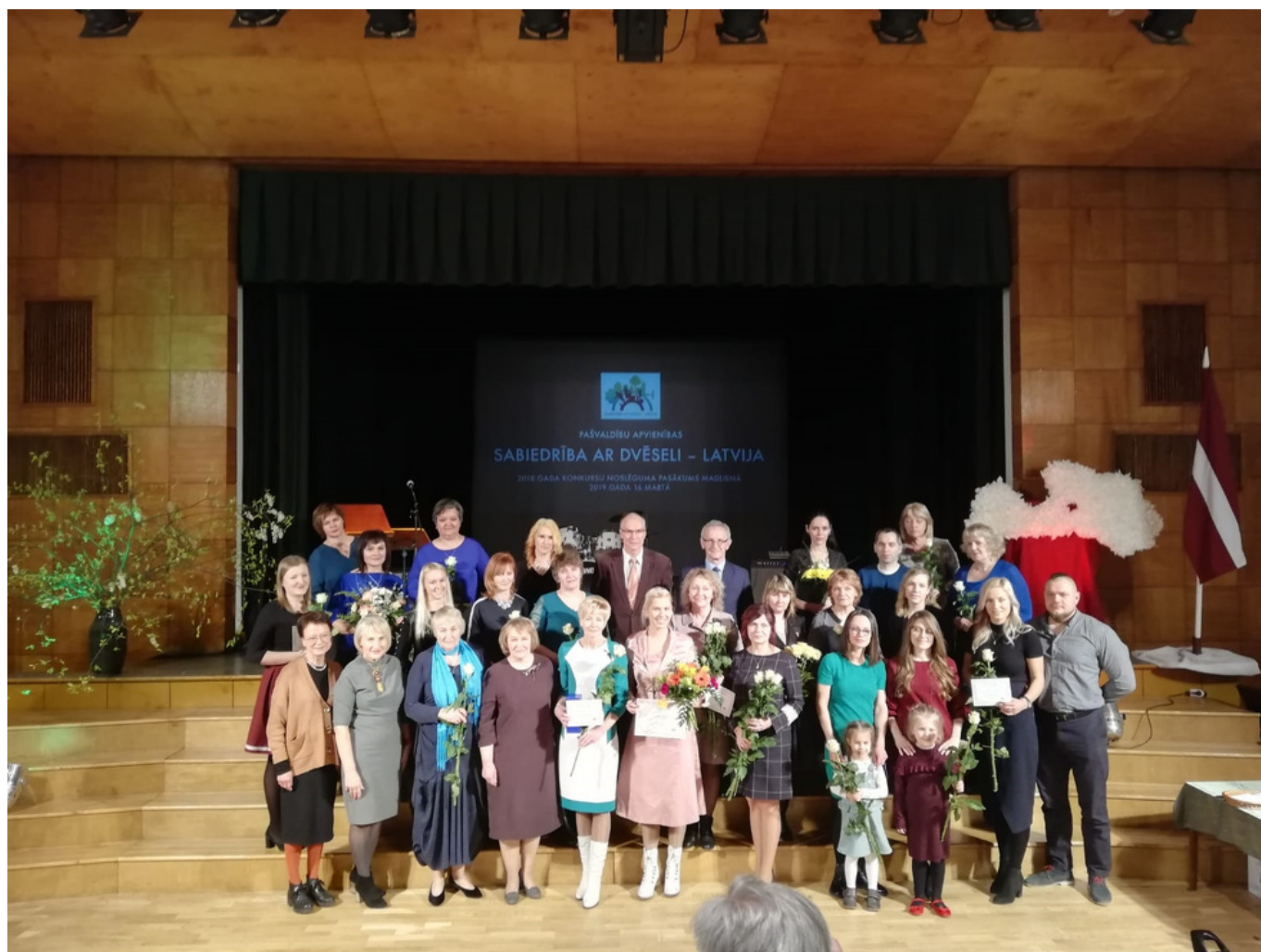
Jēkabpils novada pašvaldība Foto: A.Indriksons

Plašāk par biedrības projektu vari uzzināt šeit: